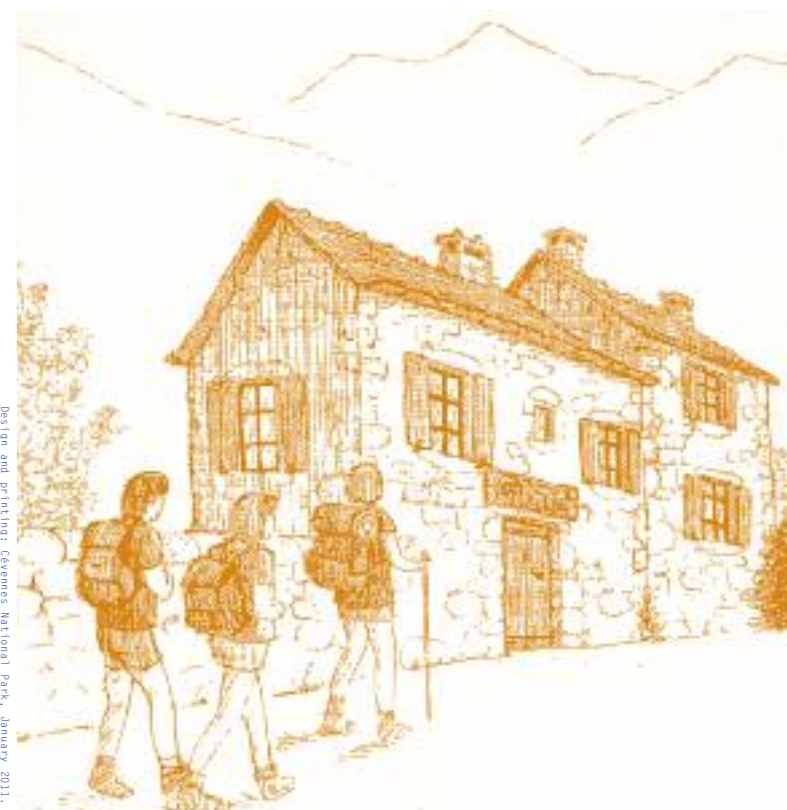
Design and printing: Cévennes National Park, January 2011.

*outer zone taken at its greatest possible extent, yet to be decided.